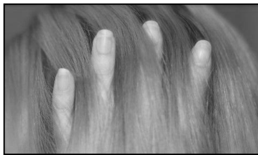
رشد مو و ناخن پس از مرگ

نویسندگان این مطالعه می گویند باور به این امر که ما تنها ده درصد از قابلیت مغز خود را استفاده می کنیم، تقریباً به مدت یک قرن است که شایع شده است. گاه این ادعا به آلبرت آینشتاین نسبت داده می شود، اما هیچ گونه مرجع علمی و یا بیانه ای در این زمینه به ثبت نرسیده است. با این وجود نویسندگان می گویند مدارک به دست آمده از افرادی که آسیب مغزی دیده اند، به همراه دیگر مطالعات مربوط به مغز نشان می دهد که افراد بیش از ده درصد مغز خود را استفاده می کنند. نویسندگان مقاله می گویند: «تعداد بیشماری از مطالعات مربوط به مغز نشان می دهد که هیچ قسمتی از مغز کاملاً ثابت و غیرفعال نیست.»