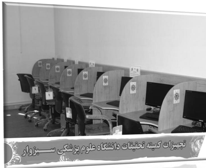
تجهیزات کمیته تحقیقات دانشگاه علوم پزشکی سبزوار

برای دریافت اطلاعات بیشتر، در زمینه فعالیت های کمیته تحقیقات دانشجویی میتوانید به اساسنامه کمیته های تحقیقات دانشجویی دانشگاه های علوم پزشکی کشور موجود در سایت کمیته تحقیقات مراجعه نمایید.